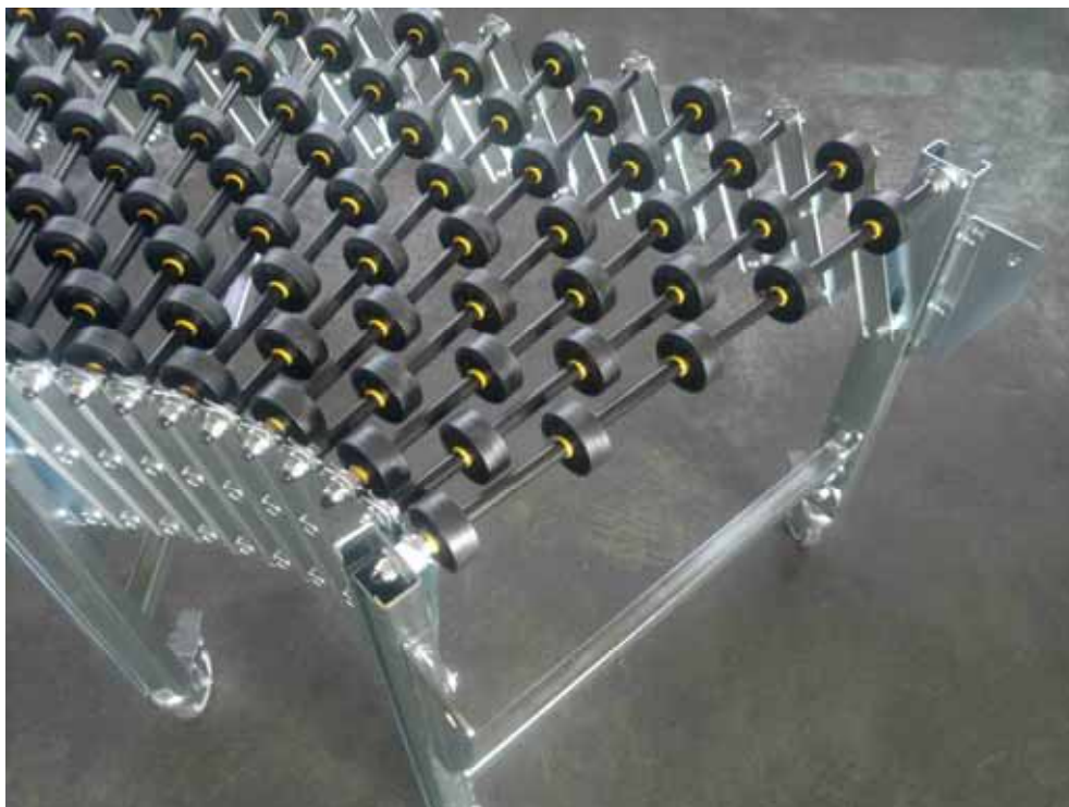
Fig. 1 - mod. LRG-Oce

Questo modello, molto versatile, rappresenta il nostro “ entry level ” per quanto riguarda le rulliere folli estensibili ed è rivolto al trasporto di colli leggeri; le rotelle interamente in plastica lo rendono un modello economico ma affidabile.