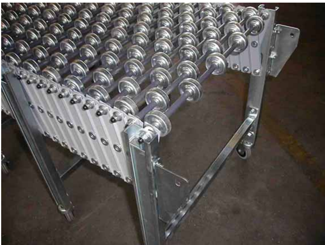
Fig. 3 - mod. MRG

Questo modello con rotelle completamente in metallo a riempimento di sfere è consigliato per la logistica; è rivolto al trasporto di colli più pesanti rispetto ai modelli con rotelle in plastica. Le rotelle interamente in metallo lo rendono infatti molto robusto ed affidabile.