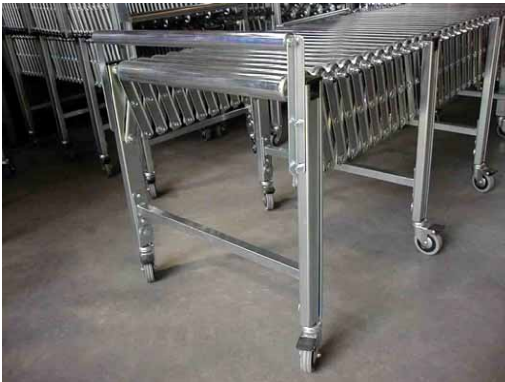
Fig. 4 - mod. ERG

Questo modello rappresenta il massimo della robustezza che possiamo offrire nel settore delle rulliere estensibili. Il mod. ERG è idoneo al trasporto di colli medio/pesanti grazie ai rulli in acciaio zinco-cromato che vanno a sostituire le rotelle dei 3 modelli precedentemente presentati.